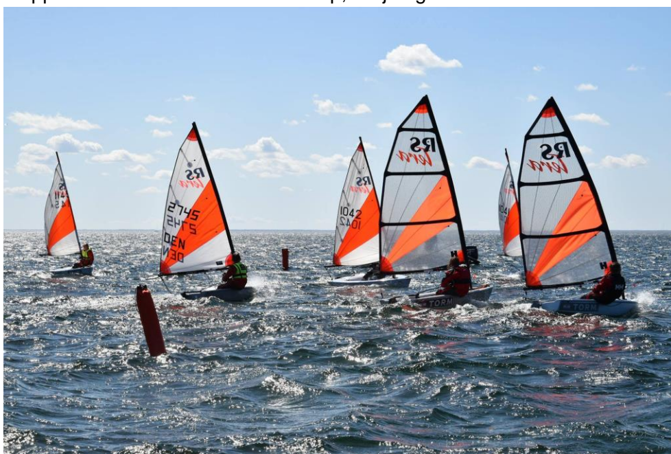
Stemningsbillede fra lørdagen